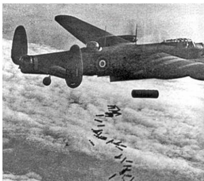
Figuur 1 foto Lancaster tijdens het afwerpen van een 4000lb bom, IWM nr.

De vlucht van de Lancaster JA902, die de volledige bemanning noodlottig werd, begon op 2 januari 1944 op RAF basis Waddington in het midden van Engeland. Hun missie zou naar Berlijn gaan. De Lancaster was voorzien van een 4000 pound Cookie bom en flink wat kleinere bommen. Door onduidelijke redenen zijn ze op de heenweg in de problemen gekomen en is de Lancaster in stukken boven de Noordoostpolder naar beneden gekomen. De grootste krater ontstond op kavel M 92. Hierop zijn ook de lichamen gevonden van de Piloot J. Weatherill en bommenrichter F.N. Looney. Beide werden op 6 januari 1944 begraven in Vollenhove. Flight engineer A.E. Cowell werd wat later begraven op 10 januari 1944. Boordschutter C. Hemmingway werd nog later in een sloot gevonden op 300 meter afstand van de krater en begraven op 2 februari 1944.