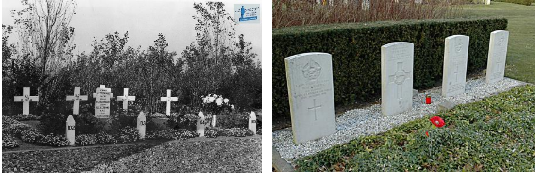
Figuur 1 De 4 graven in Emmeloord, 1952 (links) en in 2013 (rechts)